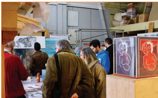
"RDV à l'atelier" visite d'ateliers d'artiste

"La création existe dans la diversité et la qualité dans chaque expression de ses différences. Pouvoir les manifester dans la proximité, dans l'espace du quotidien établit les meilleures passerelles vers le public". En 2012, la MAPRAA, organisait