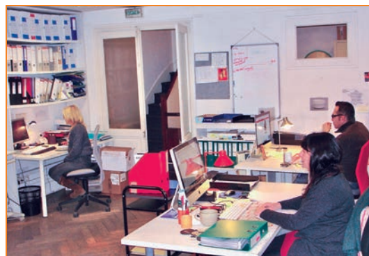
Gestion du service numérique

Toujours sur le même principe, mais en continu, il diffuse une information sur tous et pour tous, prenant en compte la vraie diversité, celle du terrain.