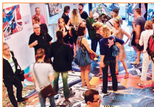
Expositions au rez-de-chaussée