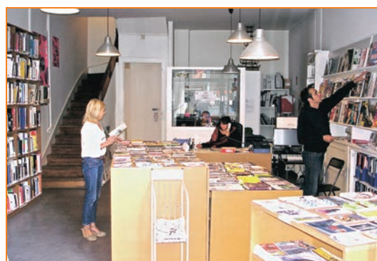
Accueil - Documentation